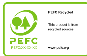
Tabel 2. Kokkuvõte PEFC kasutusvõimalustest tootemärgistel

7.1.2.2.1 Märgist „PEFC-ringlussevõetud“ kasutatakse juhul, kui toode sisaldab ainult ringlussevõetud materjali (vt ringlussevõetud materjali määratlust alapunktis 3.15). Märgise nimi on „PEFC-ringlussevõetud“ ja märgise sõnum „[See toode] pärineb ringlussevõetud allikatest“. Sõna [see toode] võib asendada sertifitseeritud toote nimetusega või sertifitseeritud tootes sisalduva materjali nimetusega, millele märgis viitab. Sõnade asendamiseks võib kasutada märgise generaatorit.